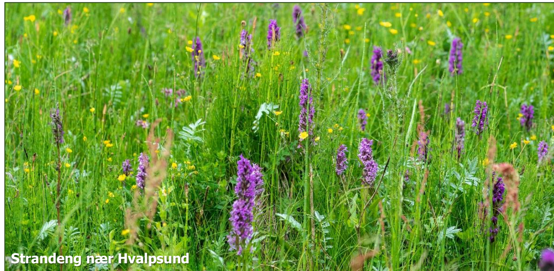
Strandeng nær Hvalpsund