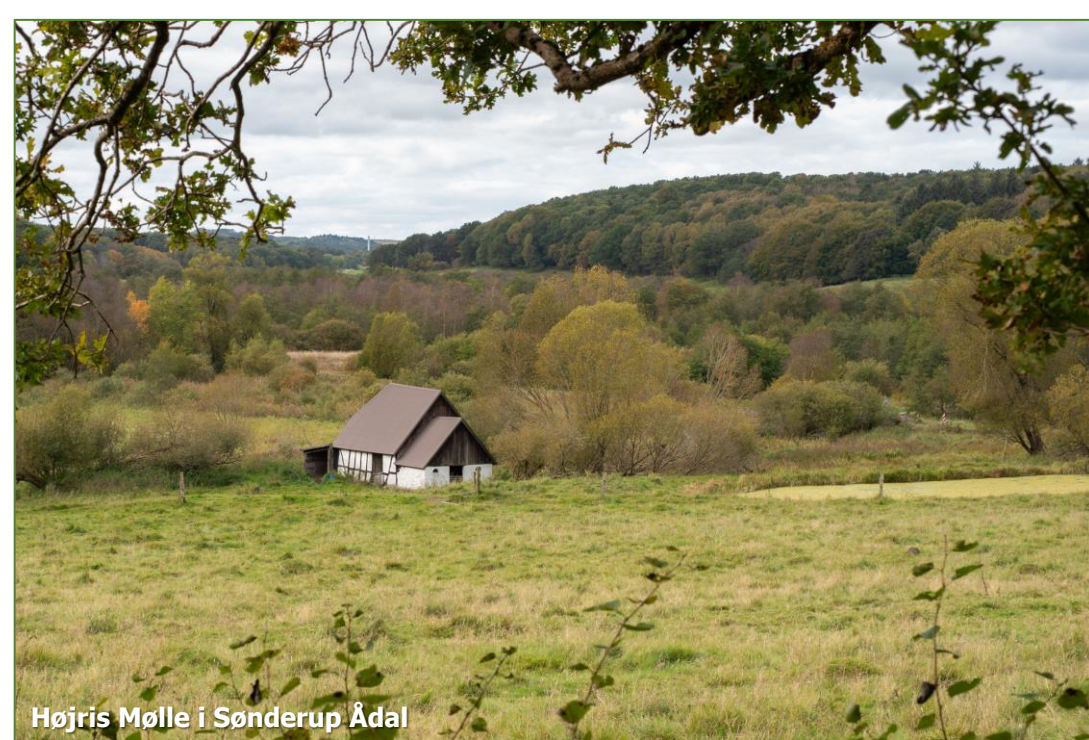
Højris Mølle i Sønderup Ådal