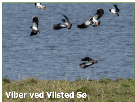
Viber ved Vilsted Sø