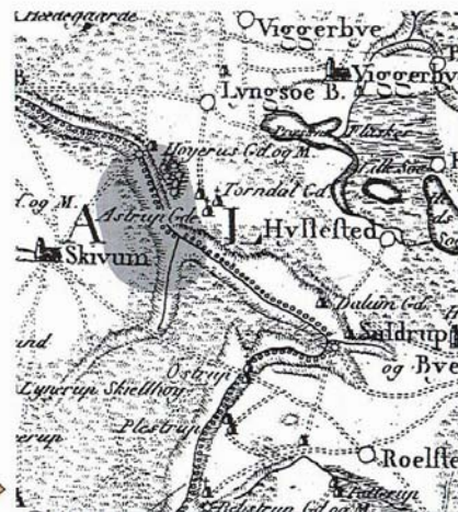
I 1791 var området præget af store, spredt bevoksede hedestrækninger. Videnskabernes Selskabs kort 1791.

De nye tider med udskiftning og skovindfredning omkring år 1800 bevirkede, at hede- og overdrevsarealerne langsomt skiftede karakter og efter fællesskabets ophør blev lagt til de enkelte gårde. Afgræsningen mindskedes, men ophørte ikke, træerne fik fred og kunne vokse op. Og da egen tåler kreaturers stadige nedbidning,