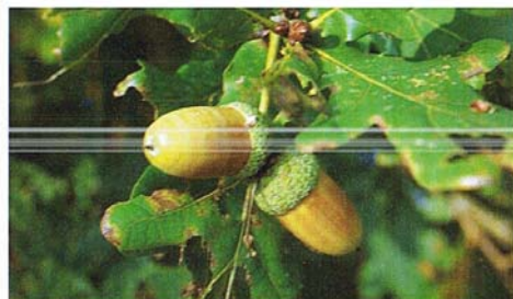
Egene i Højris Mølle er stikeg af den oprindelige jyske form.

Naturfonden har derfor siden erhvervelsen udarbejdet en detaljeret plejeplan for ejendommens drift for at sikre og bevare både de natur- men også de kulturhistoriske værdier, der knytter sig til stedet i så rigt mål.